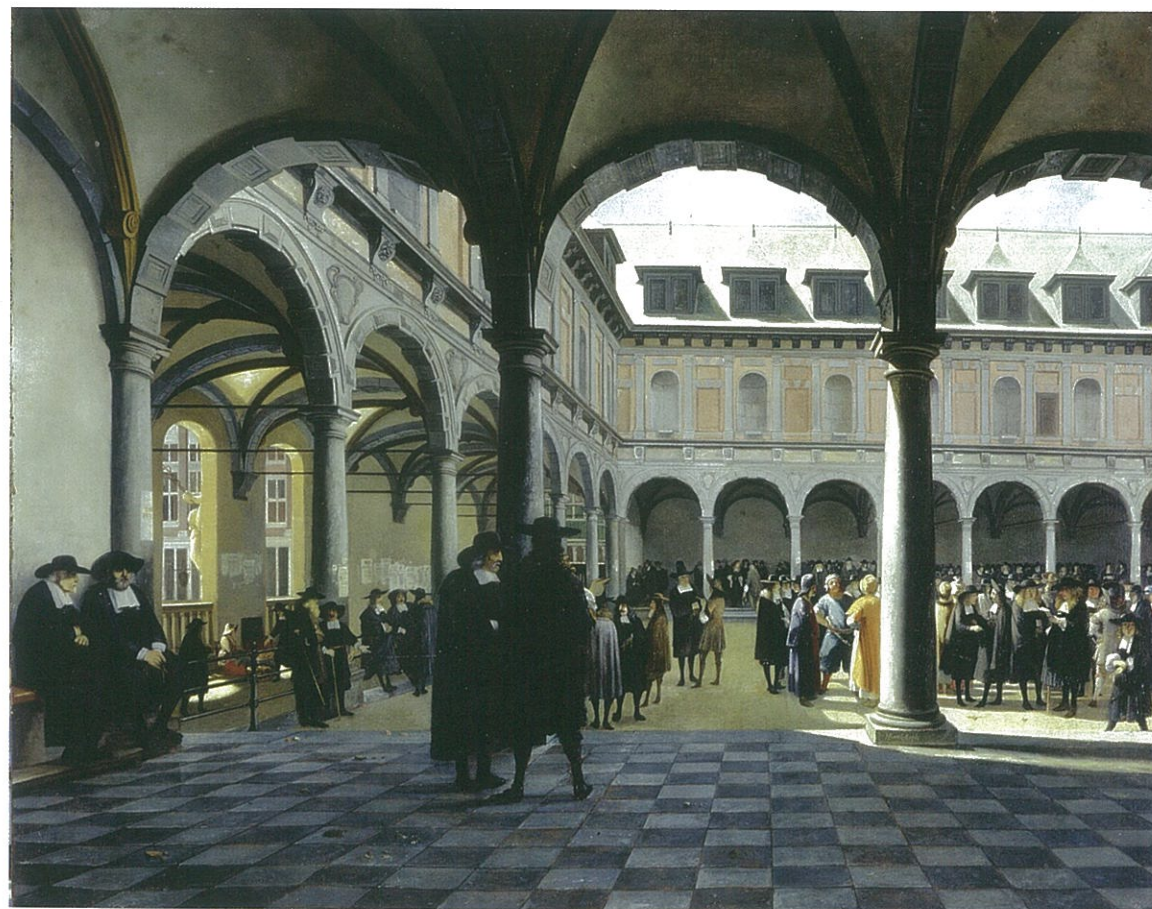
Gezicht op de Amsterdamse Beurs, ca. 1670 door Job Adriaensz Berckheyde. Herkomst: Museum Boyamns van Beuningen. Veel kooplieden uit den vreemde kwamen naar Amsterdam door de uitstekende handelsinfrastructuur, zoals de uit 1609 stammende Beurs.

De nieuwkomers spreidden zich meestal ook binnen steden niet gelijkmatig uit. Binnen Amsterdam, Haarlem en Leiden ontstonden buurten met grote concentraties immigranten.