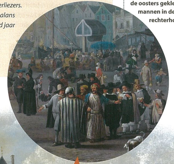
De Dam, met het Paleis in aanbouw, door Johannes Lingelbach, 1656. Collectie Amsterdam Museum. Amsterdam wemelde in de zeventiende eeuw van de migranten en andere bezoekers, zoals de oosters geklede mannen in de rechterhoek.